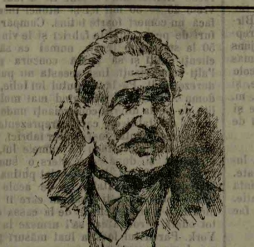
D. Săganța, președintele consiliului de miniștri spanioli, care tratează cu d. Mac-Kinley stabilirea preliminarilor de pace între Spania și Statele Unite ale Americii de Nord.

Să nu mai îndrăzniți să vorbiți de cinste, că vă plesnim cu mormane de dosare.