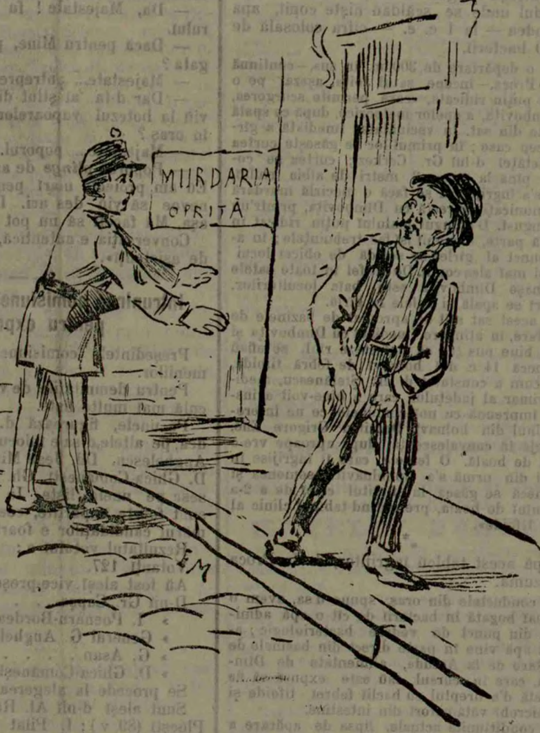
— Du te dracului! Ce, nu sunt în țara mea?