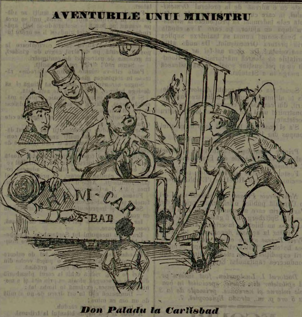
Don Paladu la Carlsbad

gem că, în așa condiții, școala face mai mult rău de cât bine. Dacă școlile engleze dau rezultate pe cari le învidiază azi cele mai multe State continentale, cauza e că în Anglia nu se încasarmază tinerimea ca, de pildă, prin Franța, ori pe la noi, în internate urbane, adevărate pușcării, unde școlarii, blestemându-și soarta, își chinuesc memoria, își ruinează sănătatea și și înstreinează spontaneitatea de caracter, spre a cuceri niște diplome cu cari, fără milă, vor smulge de la alții slujbele Statului.