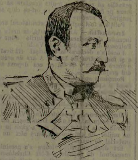
Emilio Diaz Moren. — A fost comandantul incrucișătorului cunoscut Cristobal Colon , vasul amiral al flotei spaniole distrusă la Santiago. Este acum prizonierul americanilor. Cristobal Colon a fost cumpărat de Spania, cu puțin înainte de izbucnirea războiului, de la guvernul italian.