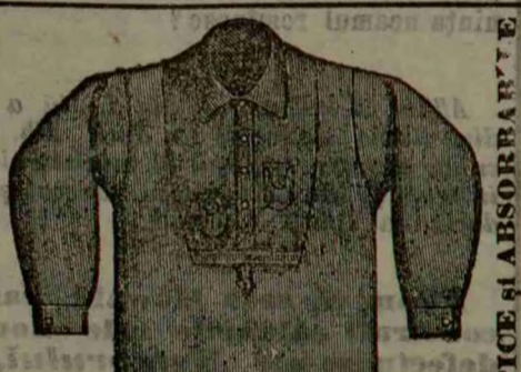
CĂMAȘA HYGIENICĂ FRANCEZĂ