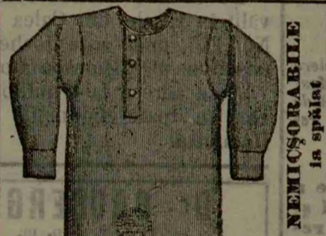
FLANELA HYGIENICĂ P. BĂRBAȚI

• Astăzi grație încercărilor chirurgilor francezi și ruși Vata de Turbă este întrebuințată în toate spitalele și adoptată de Ministerul de Război ca materie de pansament, pe de altă parte țărani au mers înaintea chirurgilor în întrebuințarea Turbel de oare ce la un lucrător rănit grav, care și-a învelit piciorul într-o bucată de Turbă s'a putut constata în mod științific proprietățile acestei substanțe originale. Țesătura higienică franceză cu fibre de Turbă care după multe încercări D-rul Rasurel a reușit a realiza, posedă de la sine o putere enormă de absorbere și de evaporatiune, astfel că îmbrăcat cu această îmbrăcăminte de Vată de Turbă răceli nu sunt posibile, mai mult încă virtutea cea mare antiseptică a Turbel nimicește toate politeratiunile microbiice formate din cauza transpirațiunii. Țesătura higienică franceză a D-rului Rasurel poate fi considerat ca un progres imens și toată lumea pentru a evita răceli și ori-ce boală ar trebui să poarte această îmbrăcăminte.