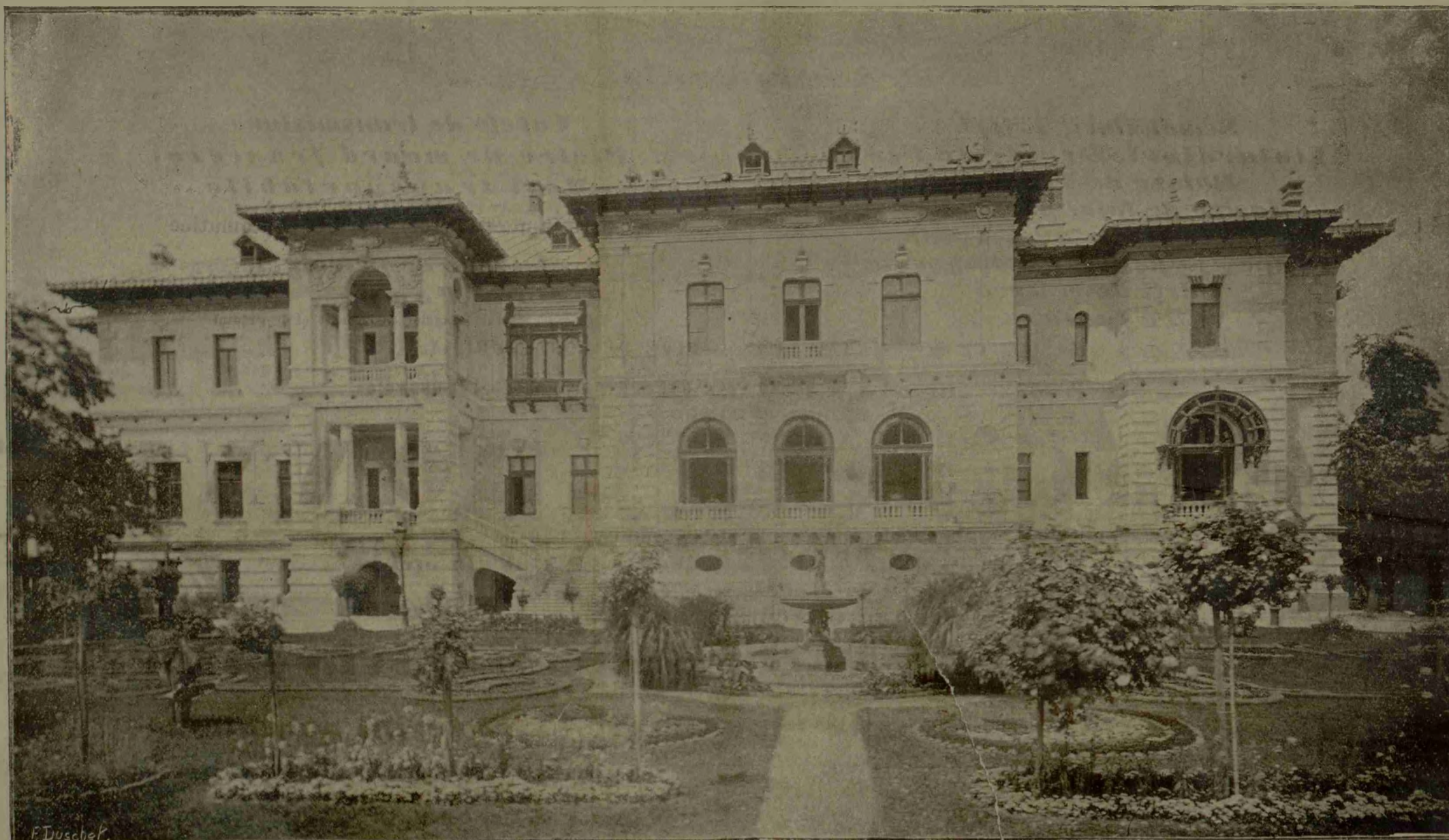
Palatul de la Cotroceni

Dinspre Castelul Cotroceni bate un vînt de liniștire și alinare. Copacii din falnicul parc, chiar ei înșiși, în dulce șoaptă, par a-și spune fericirea ce simt iar Romîni iși lunecă din gură în gură o vorbă mai bună, descrețînd frunzi, dînd voie unui suris să se nască pe buze.