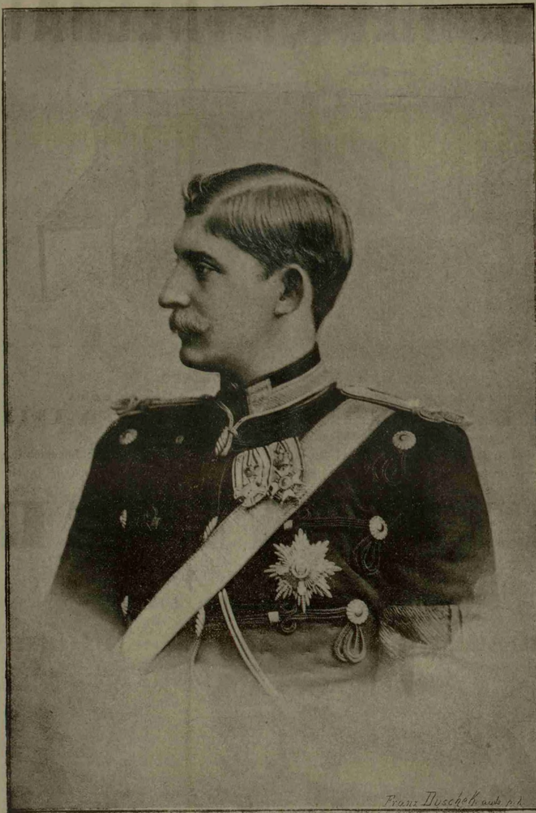
A. S. R. Principele Ferdinand

Și numeroasele cazarme din apropiere, și vastul poligon, cimp de defilare al viitorilor eroi, și biserica din curte, par'că te-ar face să retrăiești, cu gândul, o clipă din viața Evului mediu, liniștită, retrasă în pietate și setoasă doar de viteji.