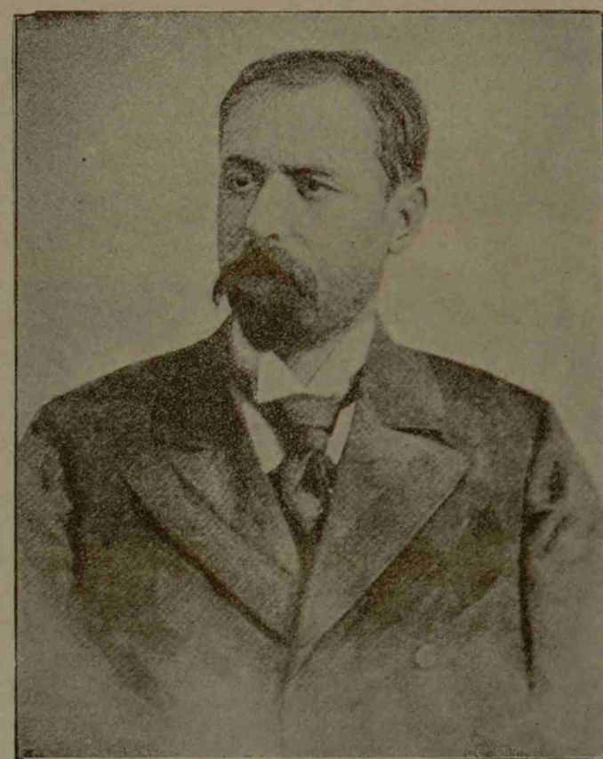
C. VELICICOV MINISTRU DE INSTRUCȚIE PUBLICĂ