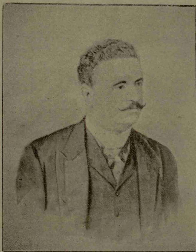
DUMITRU C. STOLLOV PRIM-MINISTRU ȘI MINISTRU DE AFACERI STREINE