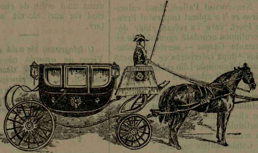
Echipajul în care a fost condus Țarul

Dar nu înțelegem pe Sturdza, șef de guvern, Sturdza ocupînd locul în evidență, Sturdza reprezentînd guvernul țării în străinătate.