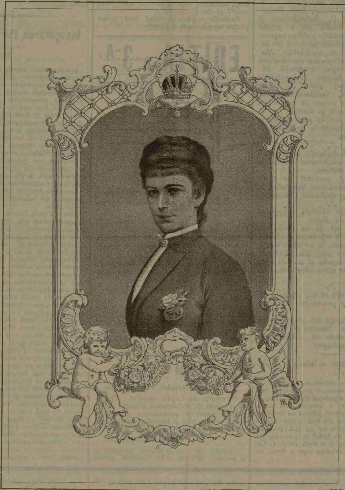
M. S. IMPARATEASA AUSTRIEI

Toți oamenii, mai cu seamă cei cari sunt întru cit-va inteligenți, au o aplecare mai mult sau mai puțin puternică către fantastic; dar, în general, cînd se viețuiesc între indivizi cu o instrucțiune și cu o inteligență aproape la fel, îndreptările reciproce sunt în stare să împiedice dezvoltarea fantasticității. Se petrece cu spiritele omenești ceea ce se petrece cu pietrele cari se prăvălesc pe albia unui torent: li se tocesc virfurile, capătă o formă rotundă, care le permite să alunecă mai cu ușurință, împreună, în lungul curentului, fără a se fărîma unele de altele.