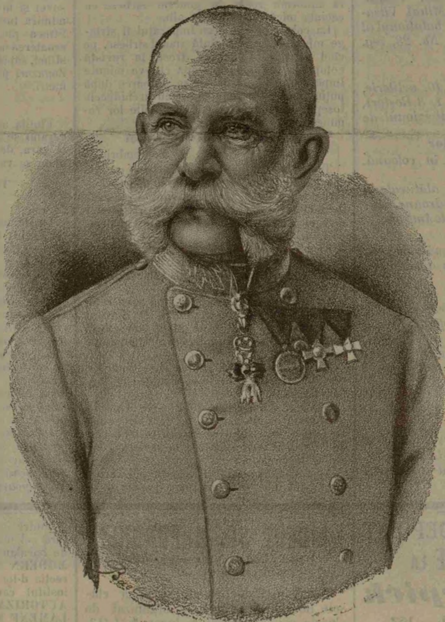
M. S. IMPARATUL FRANTZ-IOSEF I