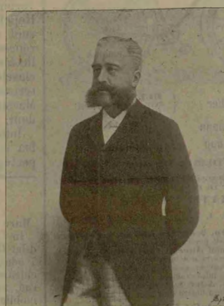
Contele Goluchowski Agenor