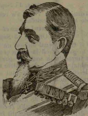
Barozzi Constantin General