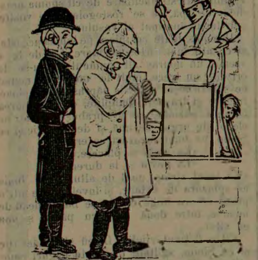
dolarul un puduche. Ilic atunci, desmetinduse, bagă mîna sub-suoară și întinde americanului un păduche...

Americanul care conta pe această raritate, nu socotise însă și pe cel d'ouă tovarăși.