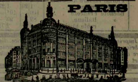
GRANDS MAGASINS DU