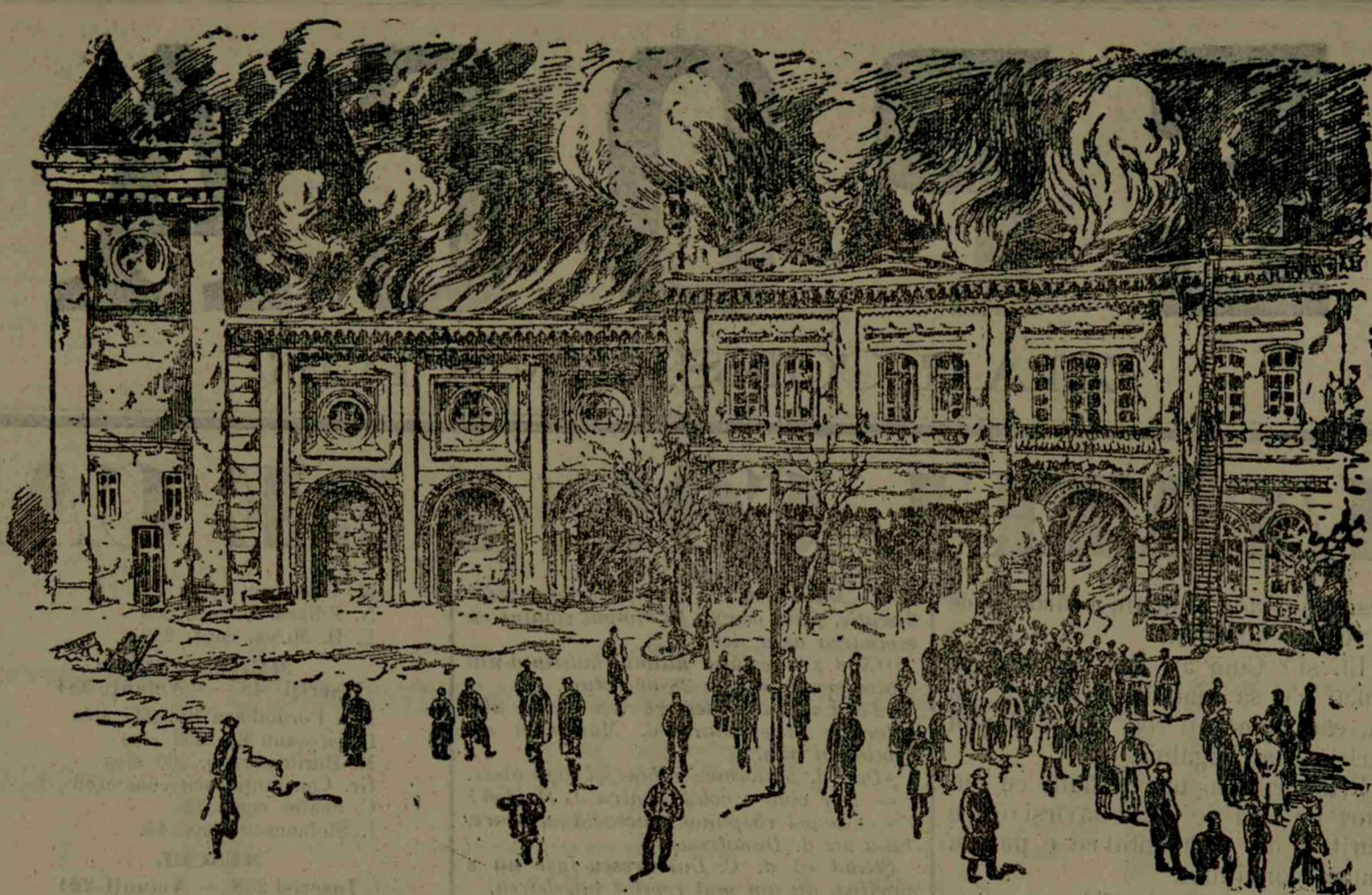
Arderea Teatrului Liric

Cînd se întimplă chiar, vre-odată ca tea-