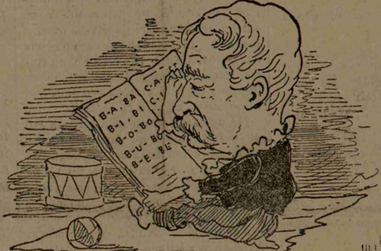
PAPUCA N'ARE VACANȚIE.... PAPUCA E PEDEPSIT... PAPUCA TREBUIE SE ÎNVEȚE LECȚIA! Hi! Hi! Hi!...