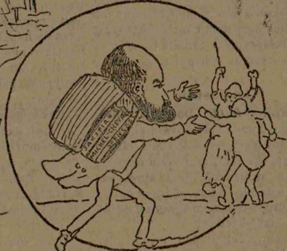
PARTISAN AL INTERVENȚIEI STATULUI CHIAȚ ÎN CHEȘTIUNI DE PĂRUIALĂ.