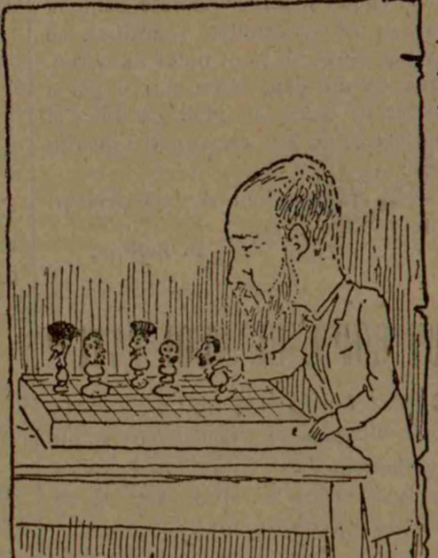
MAY LA CURȚEA DE APEL, ȘAH LA TRIBUNAL.