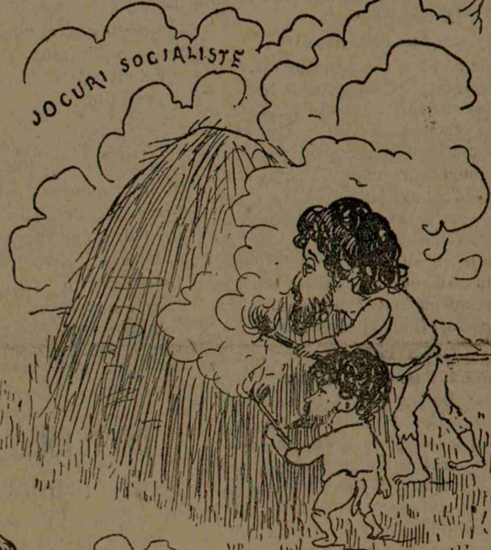
NU E FUM FĂRĂ FOC.