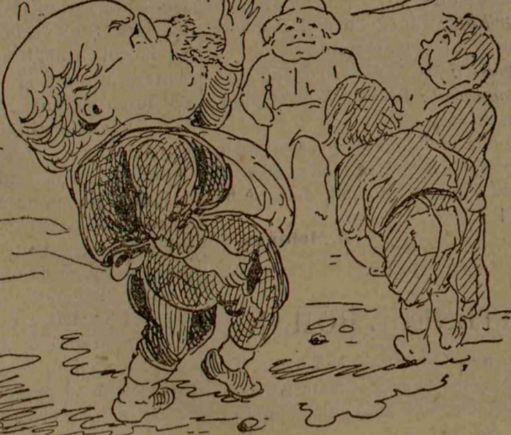
- PAJURĂ SAU SCRIS? CE OFI SE FIE DOAR ÎN BUZUNAR SE CADĂ!...