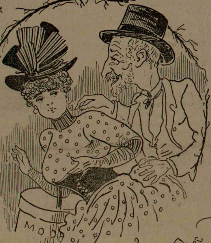
- VOIAJĂM ÎMPREUNĂ PUICUȚO?