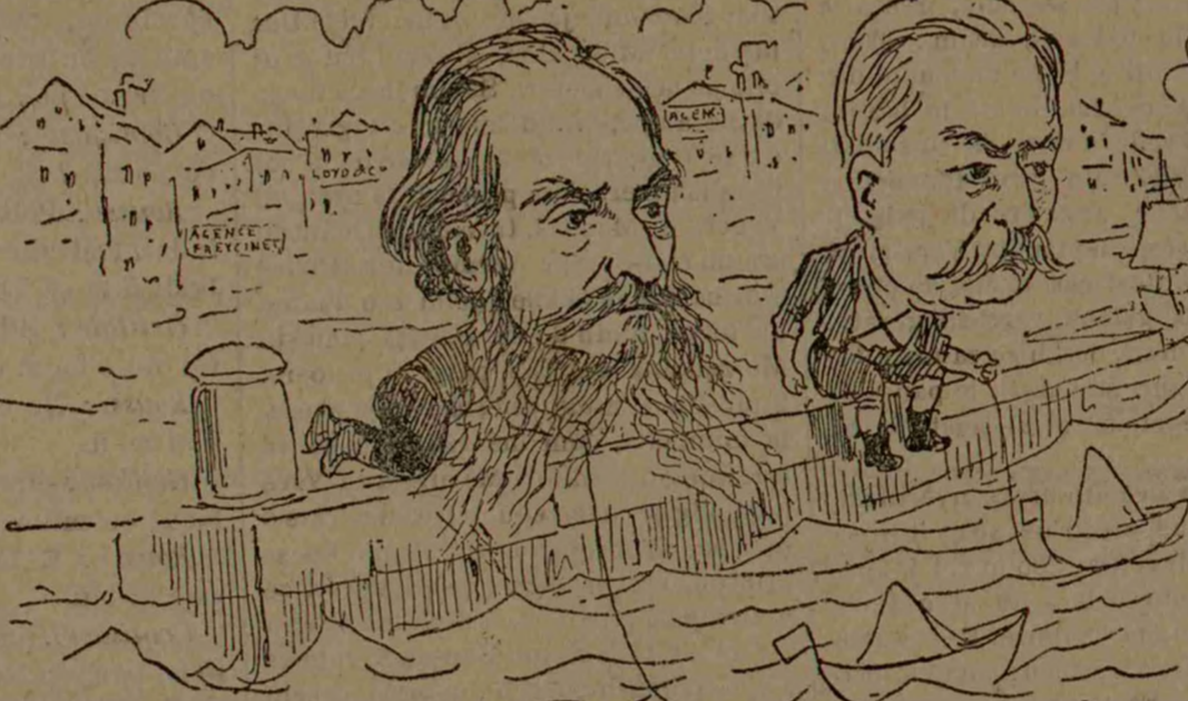
- A VENIȚ PAMPORIA LA PORTO FRANCO