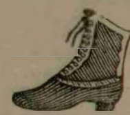
Bocaci Englezesti veritabile pentru barbati lei 42, 43, 40. Pentru baci 5, 6, 7, 8.