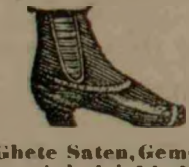
Ghete Saten, Gems, Bezeturi de lei 44, 42, 43