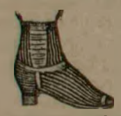
Ghete Bezeturi de glaci si vase for-ma chinezesca de lei 40, 41, 42, 43. Pentru baci lei 6, 7, 8.