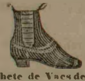
Ghete de Vase de Vermala, fasioane englezesti si chinezesti de lei 40, 41, 42.