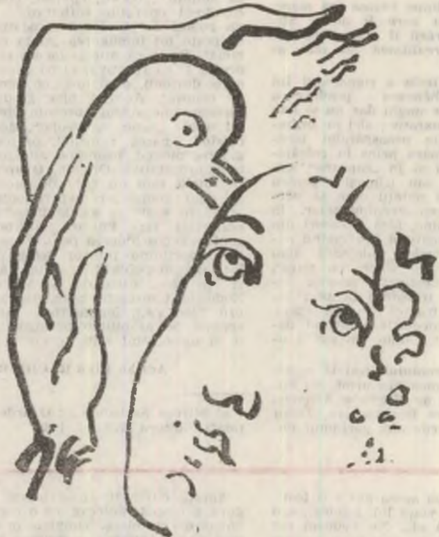
Desen de Ion Carp FLUERICI