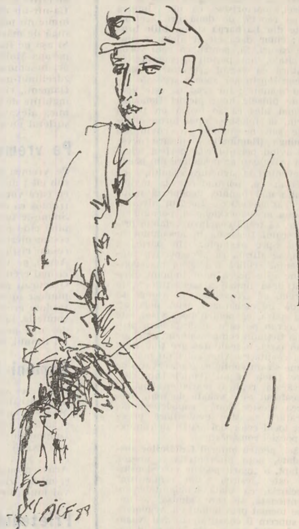
Desen de Ion CARP FLUERICI