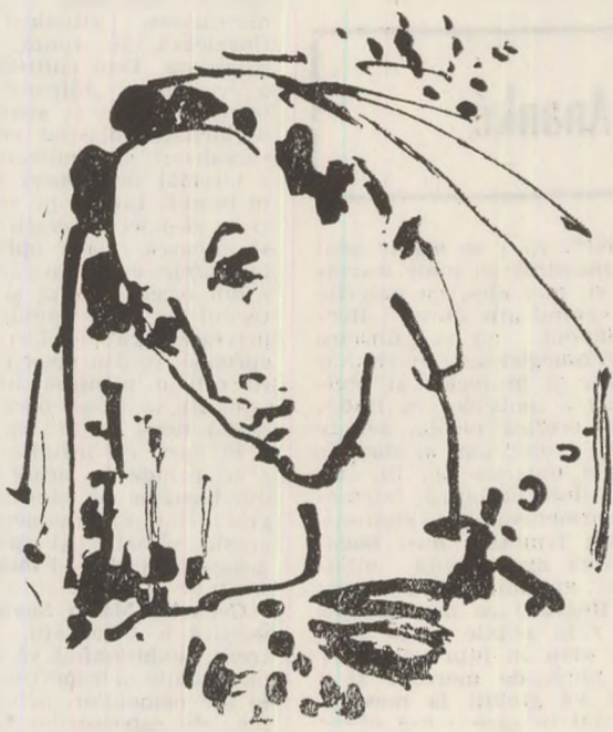
Desen de Ion Carp FLUERICI