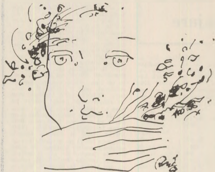
Desen de Ion Carp FLUERICI