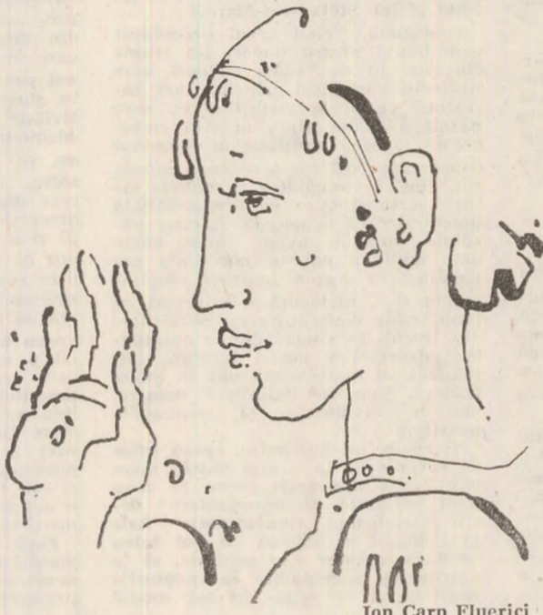
Ion Carp Fluierici