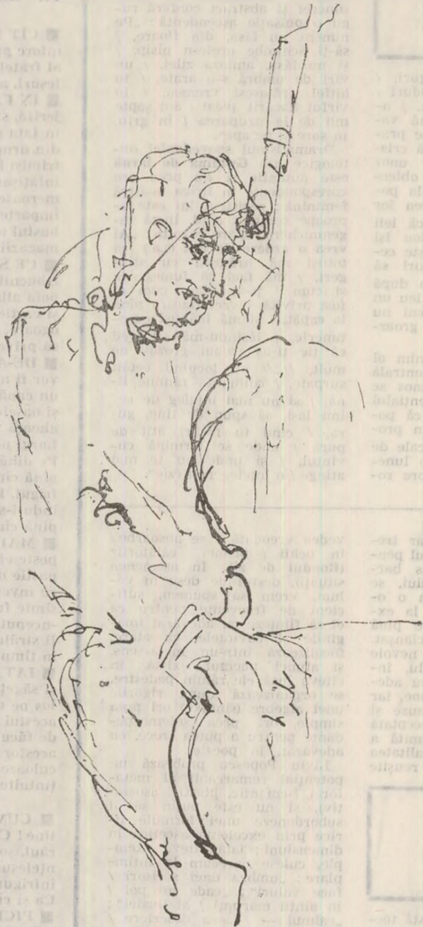
Desen de Ion Carp FLUERICI