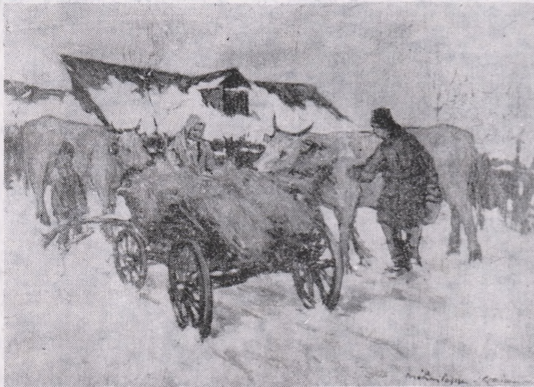
Victor Mihăilescu-Craiu: „Popas” (Din expoziția „Toamna și iarna în pictura românească”)