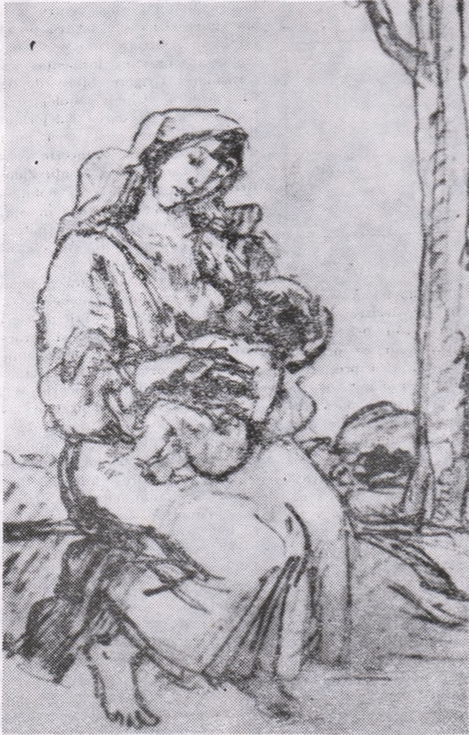
Desen de Traian BRADEAN