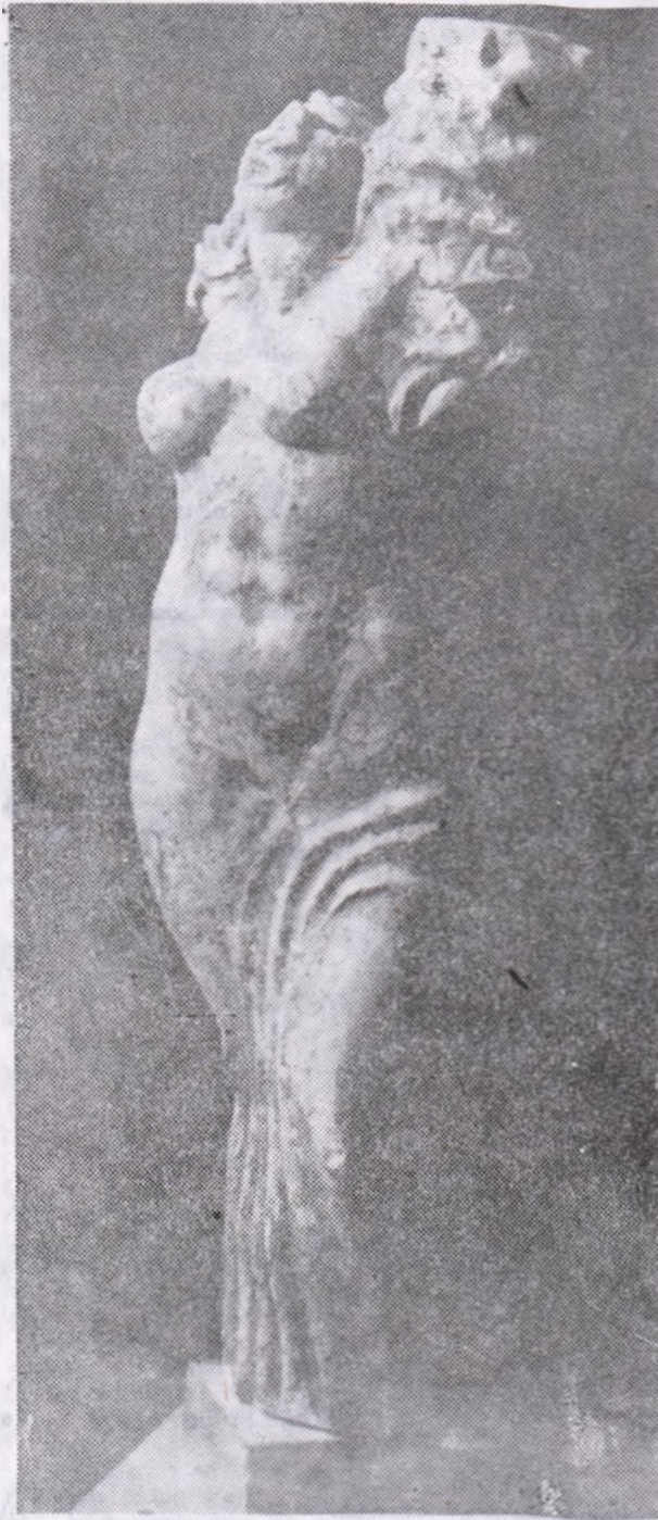
Mircea DĂNEASĂ: „Primăvara”