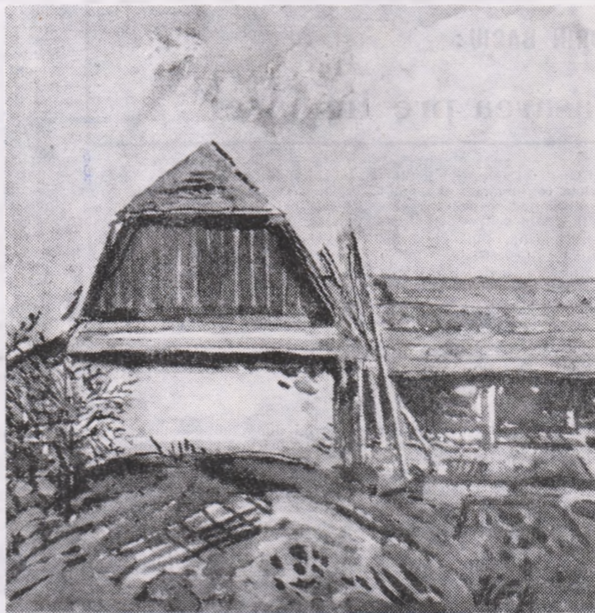
Ion Carp FLUERICI: