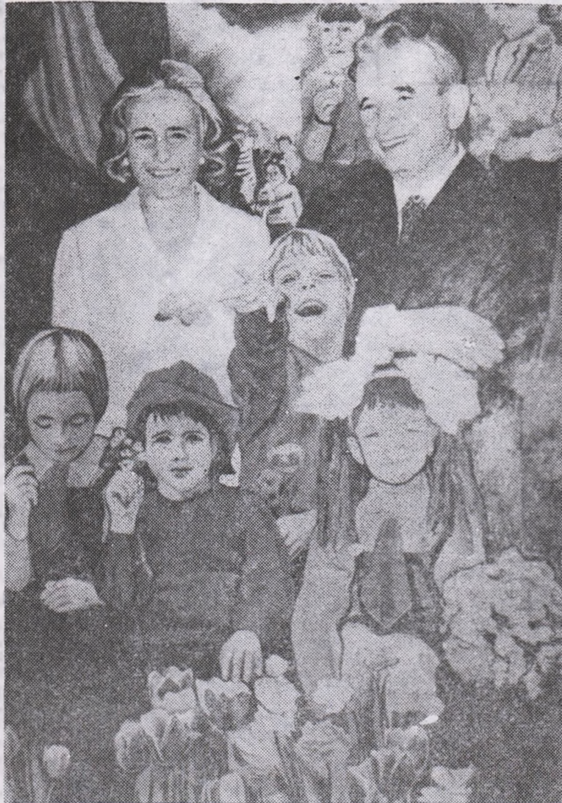
Pictură de Cornelia IONESCU