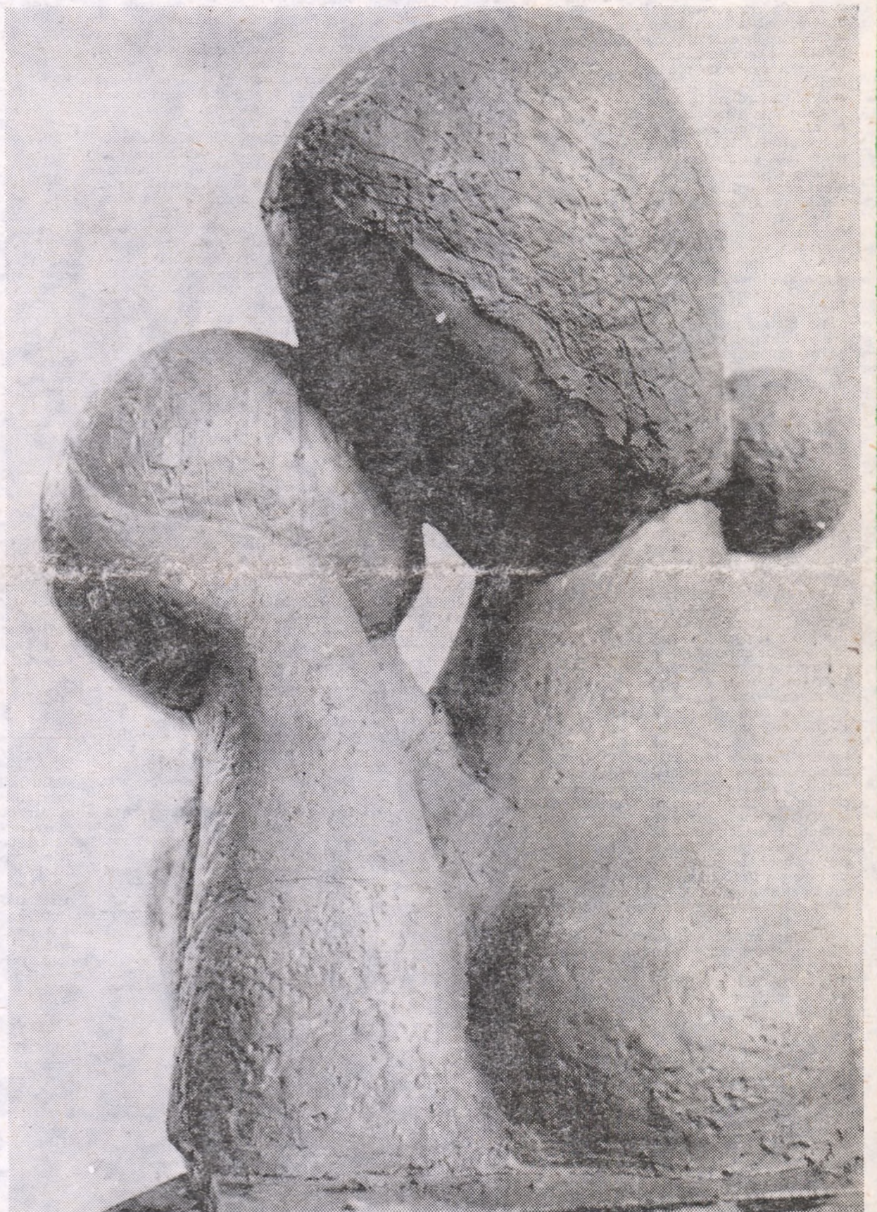
Iftimie Bărlăanu :