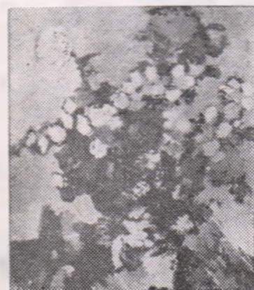
„Flori de toamnă”