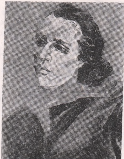
Eminescu văzut de Mircea ISPIR