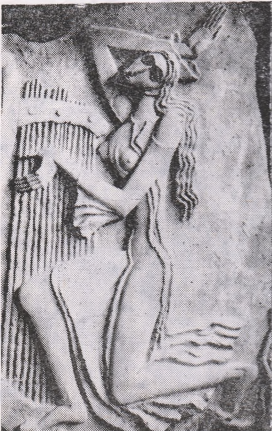
Iftimie BARLEANU: „Muzica”