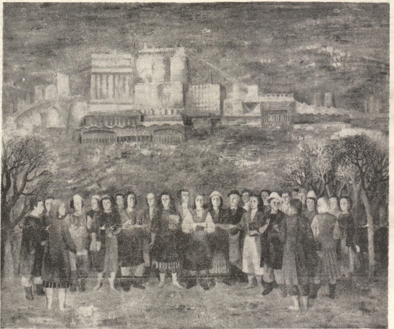
DIMITRIE GAVRILEAN :