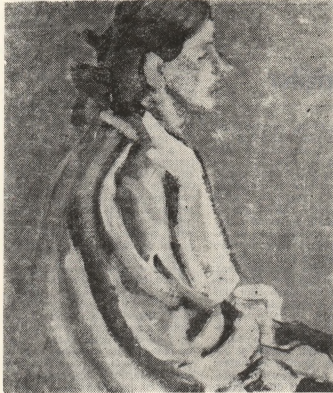
Virgil PARGHEL :