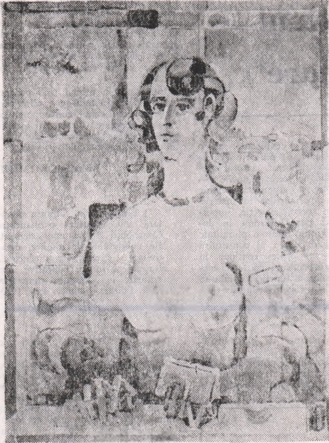
Desen de Ion Carp Fluerici