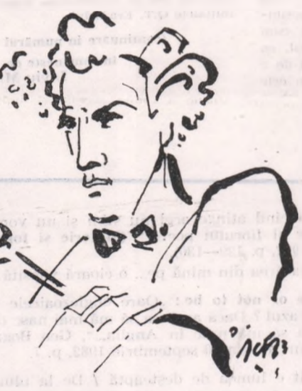
Desen de Ion Carp FLUIERICI

Cu multă maturitate și spirit organizatoric, dar în același timp și cu un bun gust desăvîrșit, Comitetul Arboroasei de sub conducerea lui Ciprian Porumbescu a elaborat un plan foarte exact de desfășurare a ședințelor lunare cu programe frumoș tipărite, cu spectacole periodice. Întrînririle Arboroasei erau urmărite cu viu interes de toți oamenii dornici de cultură, deoarece aici aveau ocazia să ia contact cu valori ale culturii românești. În marea lor majoritate spectacolele erau structurate pe piese compuse de Ciprian Porumbescu pe versuri proprii, dar își aveau locul asigurat și alți creatori de seamă ai epocii, cum ar fi Vasile Alecsandri, Mihail Eminescu Vasile Bumbac. Interpretarea pieselor era asigurată de membrii Arboroasei, care mai contribuiau la succesul acțiunilor și prin conferințe de interes general. Se poate spune că ședințele-spectacol ale Societății erau așteptate cu nerăbdare de românii bucovineni pentru înaltul lor nivel patriotic și cultural.