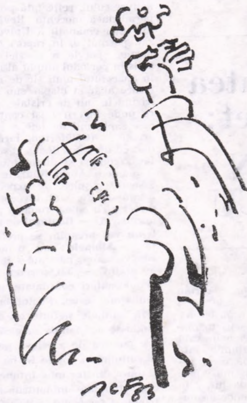
Desen de Ion Carp FLUIERICI