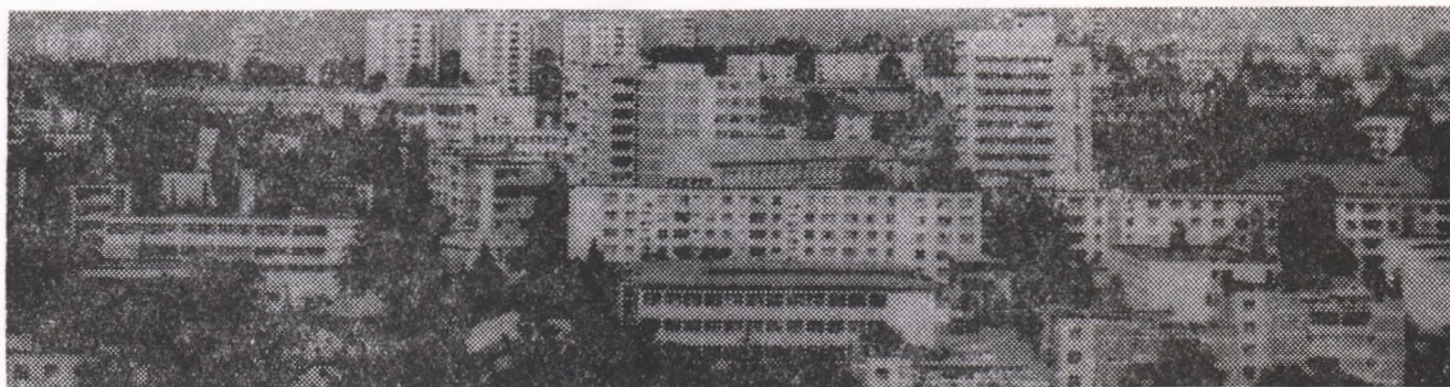
Suceava — azi