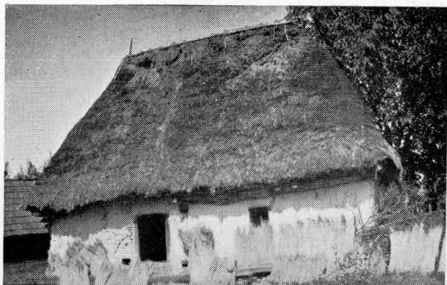
1. Casă din Măgură