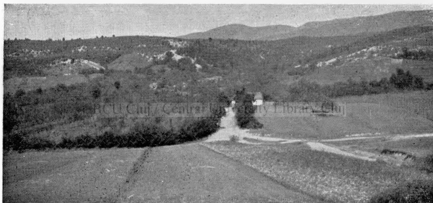
2. Vedere generală asupra comunei Vărzari