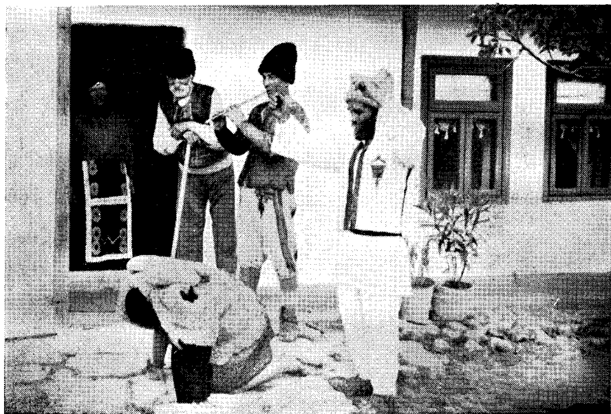
1. Pierderea oilor