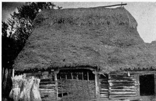
3. Șură din Câmp