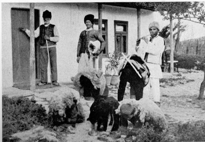
1. Venirea „Mocanilor”