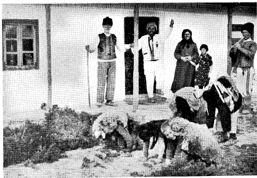
2. Regăsirea turmei