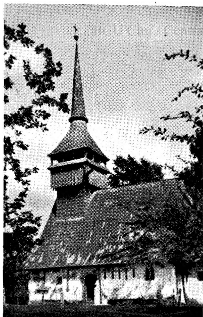
Biserica din Petroasa