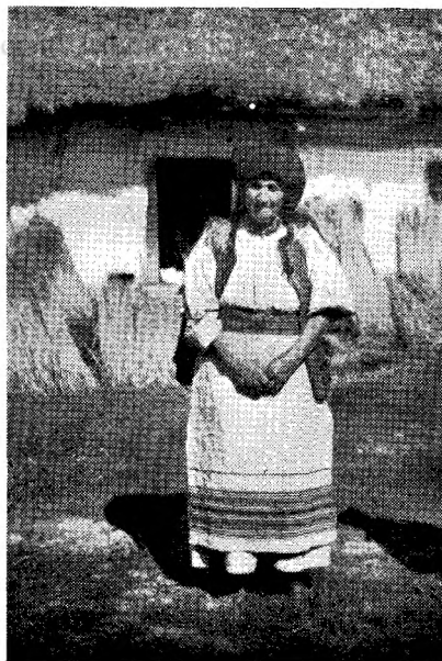
Bătrână din Măgură