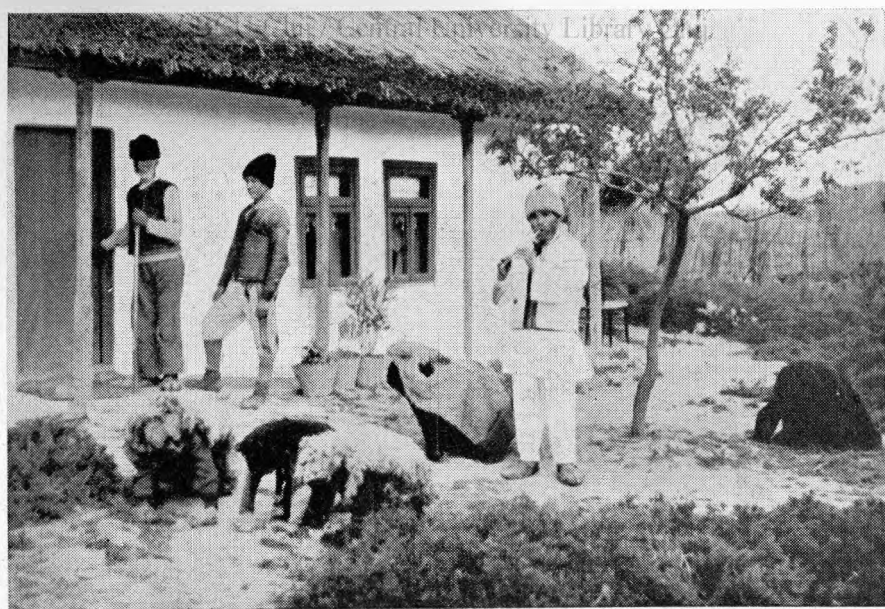
2. Venirea „Mocanilor”, varianta cu lupul (la dreapta)