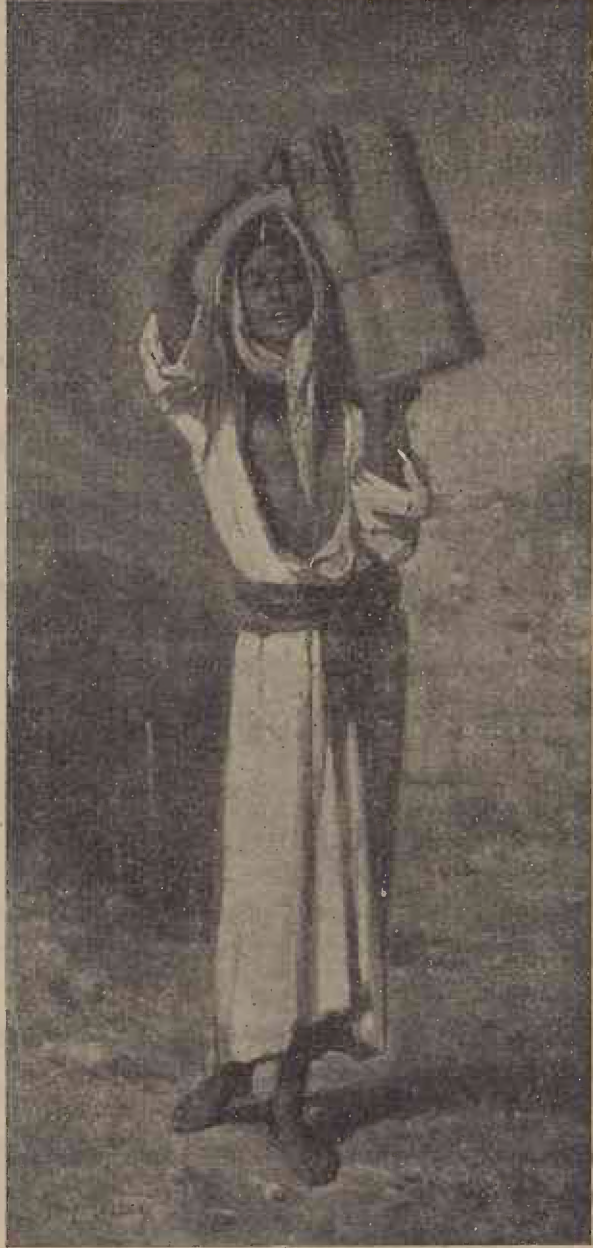
Țigancă la izvor (De pe un tablou al lui N. Grigorescu).