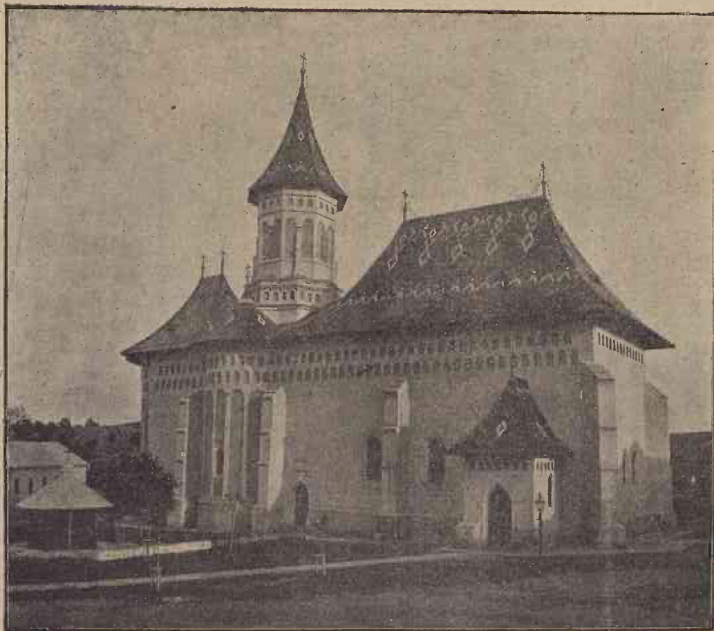
Biserica Sf. Gheorghe din Suceava (după restaurare).