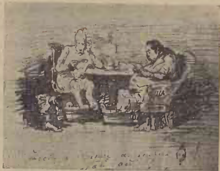
Desemn (Caricatură) (De pe un tablou al lui N. Grigorescu).