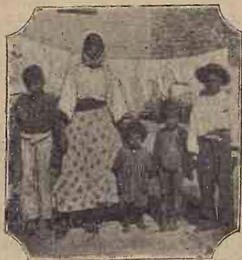
familie de țigani