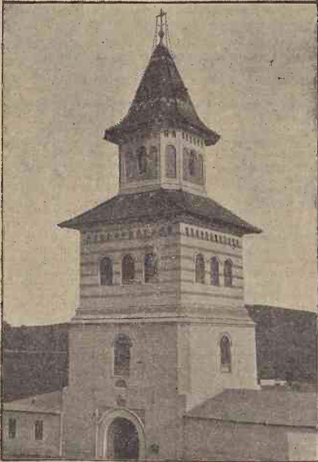
Clopotnița Sf. Gheorghe din Suceava (după restaurare).

reînchegare a grănițelor, — adunarea dela Iablanița a fost o splendidă învingere a partidului național român din Ungaria și Transilvania, a fost o superbă manifestare a poporului pentru comitetul executiv al acestui partid. După atâtea zile urâte și amare, după atâtea frământări pricinuite de ambițiile deșerte și absolut neîntemeiate, adunarea dela Iablanița va să zică verdictul poporului românesc pronunțat pentru solidaritatea națională și pentru disciplina de partid.