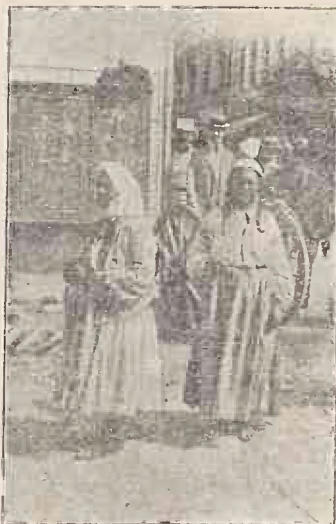
Tipuri din București