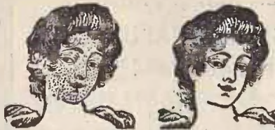
Inainte și după INTREBUINȚAREA CREMEI și PUDREI „FLORA“