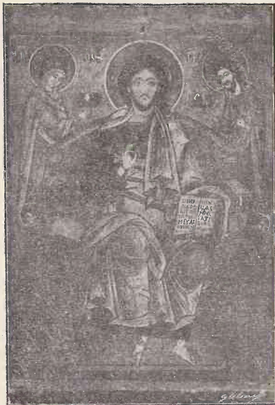
DOMNUL NOSTRU ISUS HRISTOS

Icoană dela Biserica Sf. Impărați din Târgoviște