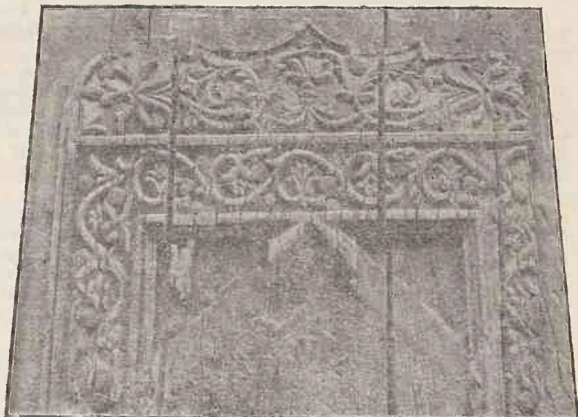
UȘĂ DE LEMN

dela Biserica Sf. Impărați din Târgoviște