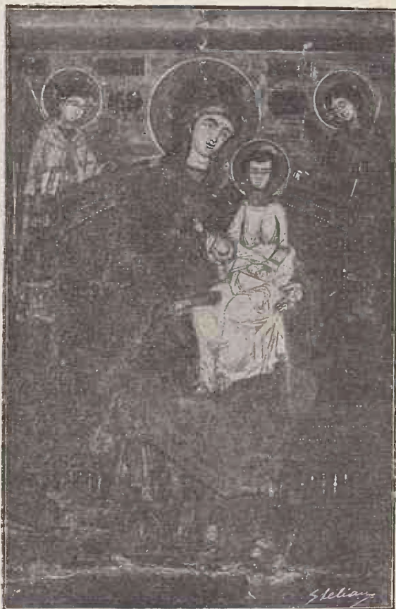
Icoana dela Biserica Sf. Impărați din Târgoviște