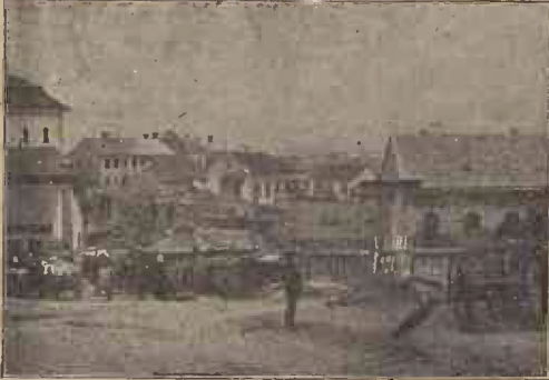
Cernăuțul la 1850.

mingea și încă cu o patimă de mama focului. Veneau și studenți mari cu profesorii lor, lepădau surtuțele de pe ei și mi-ți băteau hapucu-l, — (așa-i zicea mingei de fir de gumilastic), — până îi prindea noaptea. Apoi mergeau cu toții la grădina publică, unde se mai răcoreau la berăria ținșașilor cu câte o halbă de bere.