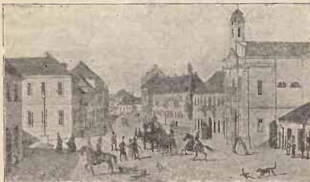
Cernăuțul la 1850.

În zilele când partea de sus a toloacei eră slobodă, cea cu verdeață eră plină de cete de soldați, sau cătane, — cum zicea la noi, — cari își făceau zățiroa (adică exercițiile). Și mi le vedeai mișcându-se rândurile dese de ostași de tot felul, în pas măsurat, din coace, până'ncolo, după glasurile ascuțite ale căprarilor mustăcioși, și sclipiau în bătaia soarelui puștile și săbiile de-ți eră drag să privești. Mai în dos însă, adică sus de tot, aproape spre marginea verdeței, își făceau de cap toboșarii și trâmbițașii, chinuindu-se cu învățatul marșurilor și semnelor ostășești, ce răsunau de pe înălțimea locului prin văzduhul curat până în dealul orașului. Un singur om nu-i auzia și nici că se supără de acest lucru, măcar