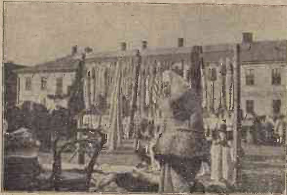
Vânzătoare de cămăși naționale.

Cam la mijlocul acestei grădini de plăcere se vedeau niște case frumoase, în cari se aflau feredeie, iar nu departe de aceste, se găsea un teatru de vară, dinaintea căruia cântă în toate duminicile banda regimentului nostru. Desdedimineață însă, găsiăi pe aicia, mai ales în aleea cea mare cu ploi, școlari de toate neamurile, ce-și învățau lecțiile. Mai vartos Românașii noștri pe aicia își alegeau locul, că dă, pentru ca să îndruga bine afurisita de nemțească, rosteau regulele cu glas tare, cât îi ținea gura, de se clătinau frunzele din copaci și clătinau din cap și trecătorii de pe drumul Ceahorului.