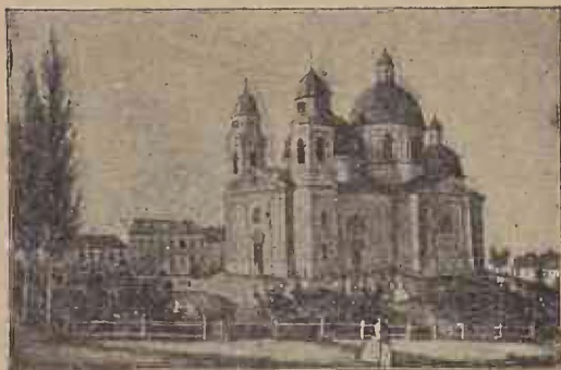
Catedrala din Cernăuți.

S'a deșteptat Românul din somnul cel de moarte și începe să-și apere de acum înainte altfel neamul, limba și legea. Se vor deșteptă și cei din Bucovina, căci timpul nu e încă perdut. Sărmana astă țară, mie întotdeauna mi s'a părut că e ca și o bucată de cremene, în care țacănesc toți procopsiții împărăției cu amnarele lor, doar, doar să scoată fiecare cât mai multe scânteii pentru pipa sa. Dar vorba e, că au dat de cremene, nu altceva. Că vor scăpără încă multă vreme,