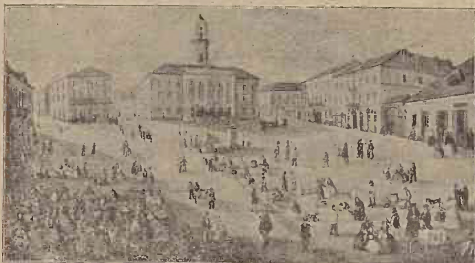
Cernăuțul la 1860.

Și acum să ne întoarcem încă odată la orașul de pe malul bătrânului Prut și să sfârșim. Cernăuțul de astăzi e mai plin încă de străini... decum eră vr'odată. Nu sosește tren în gara mare a orașului, fără să aducă noi străini. Foiesc veneticii dea întrecățul, Evreii dându-se drept Nemți Leșii amestecându-se cu Rusneicii, toți străini de țară, străini de neam, de limbă, de lege, uniți însă printr'un singur gând... să ne cotopească, să ne înghiță. Și totuși, n'au să ajungă acolo! Cernăuțul cu tot roiul de neamuri străine, nu-i perdut și oricât s'ar părea că nu mai e al nostru, dar nici