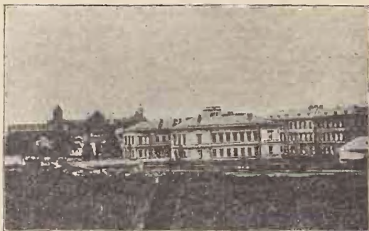
Universitatea din Cernăuți.

cu sftncii ei multă vreme capul, că ce dar să li facă credincioșilor supuși, colo la vechile hotare turcești. Și au găsit, că aveau Bucovinenii—vezi doamne,—de toate, numai cât una nu li ajungea... o universitate nemțească. Se temeau, pesemne, cei dela stăpânire, că nu se nemțise încă destul oamenii pe la noi. Ș'apoi mai trebuia, -- cum spuneau pe atunci gazetele lor trufașe — trebuia răspândită și ceva lumină dincolo de hotar, și cu scopul ăsta universitatea cea nouă cu numele prea milostivului împărat Franz Iosef, avea să fie făclia luminoasă pentru întunericul dela răsărit, cea prin care bojbăiam, adică noi nenorociții, din țara românească. Adevărul eră însă, că începuse să-i pară oblbăduirei nemțești cam mare fr ochi școala de teologie din Cernăuți, unde se învăța românește și la care