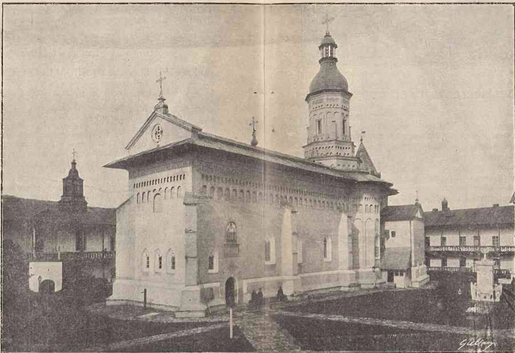
Biserica veche din 1497 dela Mănăstirea Neamțului