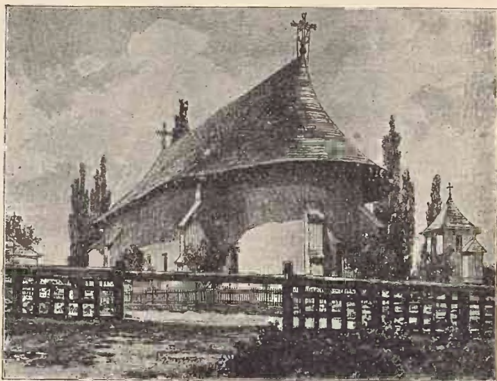
Biserica Episcopiei din Rădăuți.

Că nu mai departe decât la 1848, adică cu trei ani înainte de venirea în primblare a împărațelului, adunătura de Sași, Unguri și Secui, pripășiți la Rădăuți dela ocupațiune încoace, a găsit că burzuluiala dela 48 le-ar putea fi bună și ea la ceva și eră să facă stăpânirei o soție urâtă de tot. Mișcarea de răsvrătire dela Viena și din toată Europa, intrase în capul câtorva derbedei, de credeai că se prăpădește târgul. Inarmați cu ce au putut prinde la mână, mulți chiar cu puști și cu pistoale, au ieșit în piață și atât de mult îi buimăcise asta pe oameni, încât numărul neastâmpăraților se prefăcuse în gloată turbată, care umblă urlând prin ulițe, strică și spargea ce-i venea în cale și sbiera să se-i deie constituție . Cei mai mulți nici nu știau ce cereau, dar așa eră, se vede, duhul ce apucase cu năprâsnicie lumea întreagă. A venit, nu-i vorbă, oaste, de i-a îmblânzit pe buntușnici. Pe mulți i-a băgat la temniță, iar pe câțiva, cei cu prădăciunea și cu samavolniciele, i-a împușcat în dosul livezii mari, de lângă drumul ce duce pe la biserica episcopiei, spre Vadul Vlădichei.