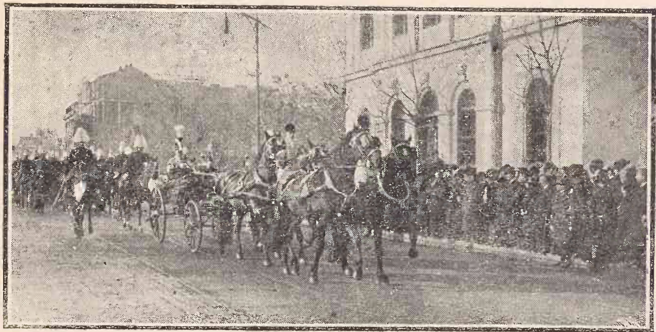
Cortegiul Regal ducându-se la Senat.