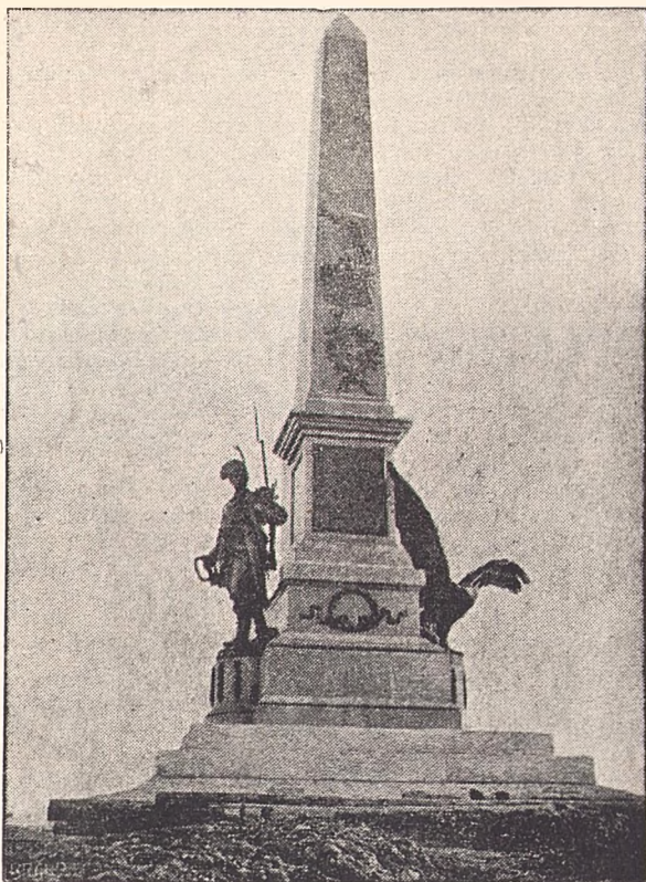
Monumentul comemorativ al reunirii Dobrogei (Tulcea).