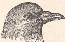
Cap de porumbiel.

Ca și păsărelele, porumbieii trăesc părechi. Bărbatul și femele lucrează împreună la construirea cuibului și împărtășesc grijile clocitului și creșterii puilor.