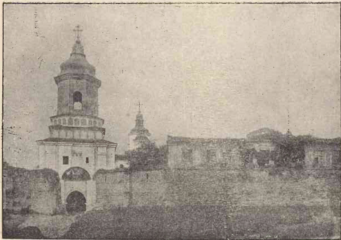
Mănăstirea Cașin: Clopotnița și zidurile.