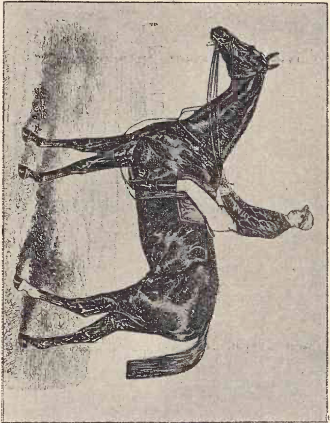
Cal englezesc (zis pur sânge)

Se constată însă că moșia Cislău nu e îndestulătoare pentru herghelie, iar calitatea pășunelor este inferioară, pentru că crește păiuș, trestică, șovar și chiar trestie.