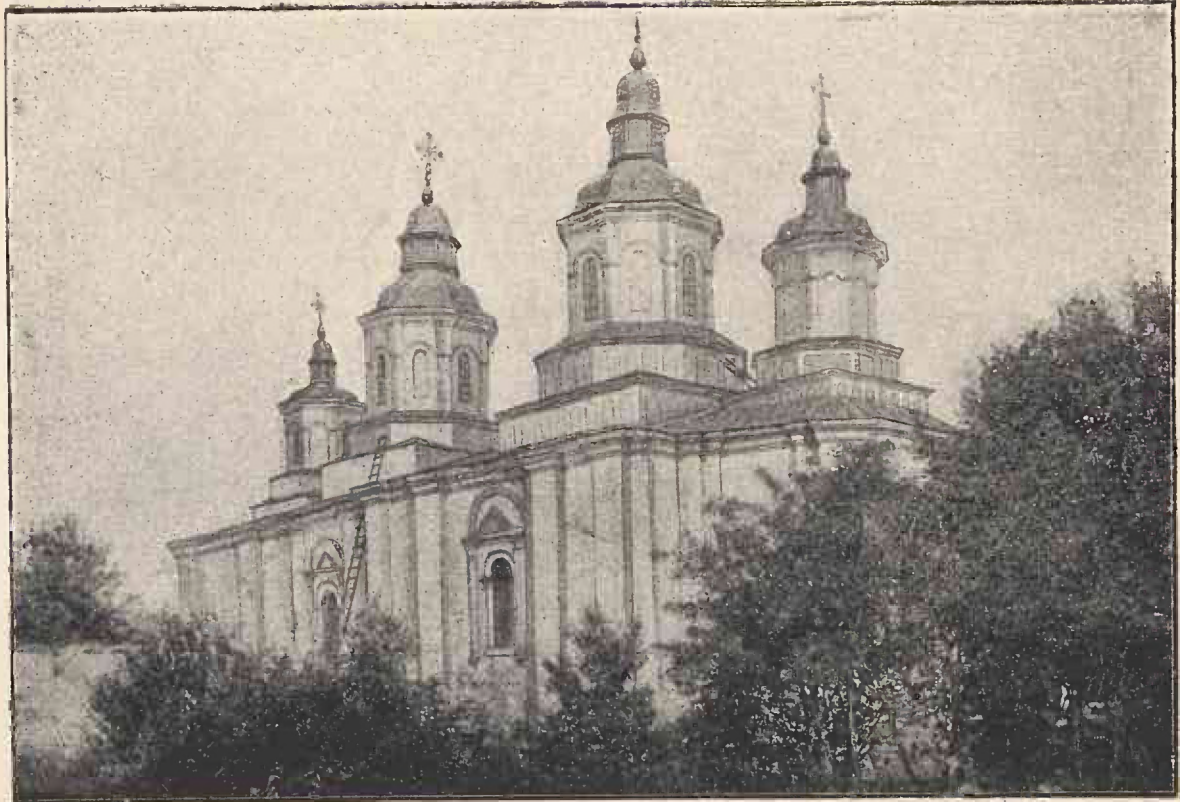
Mănăstirea Cașin: Biserica.