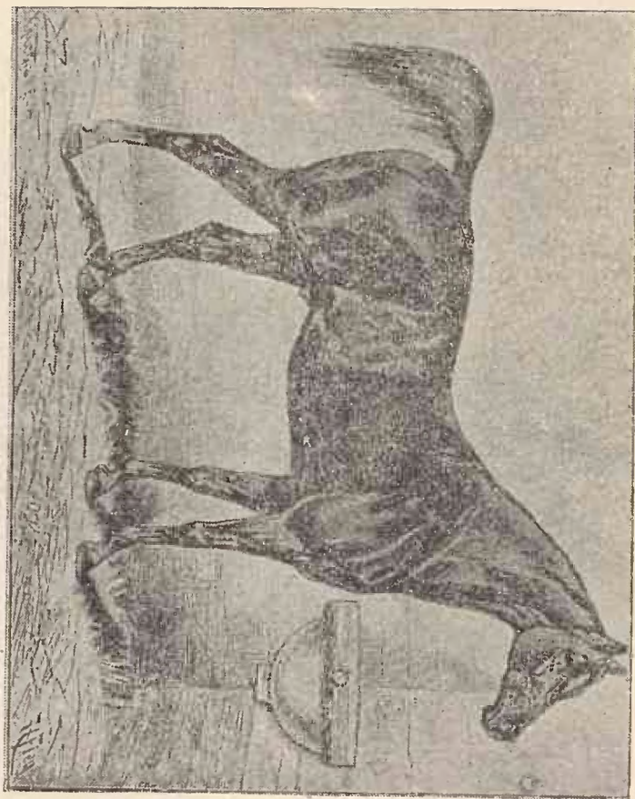
Armăsar anglo-arab.

La herghelia Făgăraș se află rasa lipița origină arabă, potrivită pentru localitățile muntoase.