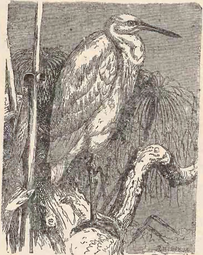
Bătlanul mic alb ( Ardea garzetta ).

Bătlanii sunt mai multe soiuri. Au picioare lungi. Degetele lor sunt trei înaintea și unul îndărăt. Degetul din mijloc are unghia cu scrijelituri cari o fac să semene a pieptene. Ciocurile lor sunt foarte lungi. Stau necontenti pândind pradă și când o văd răpăd ciocul ca fulgerul de iute, și-o înhață. Pe cap, pe spate și pe piept au pene zburlite, dar vârtoase, cari se întrebunțează ca podoabe. Bătlanii dăunează pescăria, căci mănâncă mulțime de pește. Cuiburile și le fac în copaci sau în papură și stuf. Ouă 5—6 ouă albastrii sau verzii. În timpurile de demult îi vânau cu șoimi învățați anume.