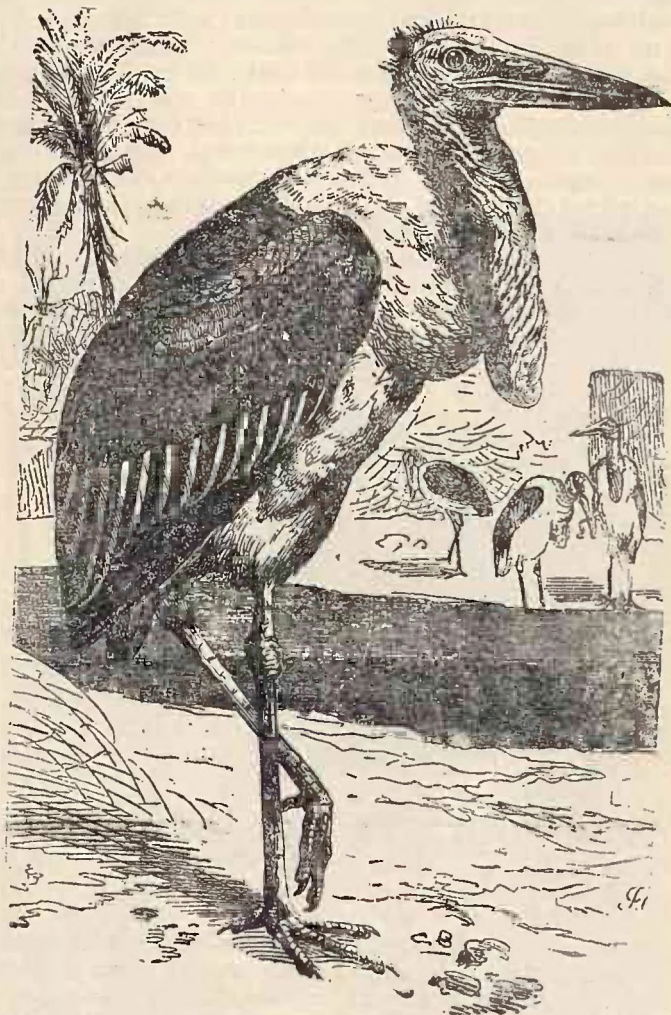
Marabu sau Cocostârcul cu gușe ( Leptoptilus argala ).

Cocostârcul negru ( Ciconia nigra ), e mai mic decât cel alb. Toate penele lui sunt negre, iar pliscul și picioarele roșii. Își face cuibul în copaci înalți. E foarte vătămător pentru pește.