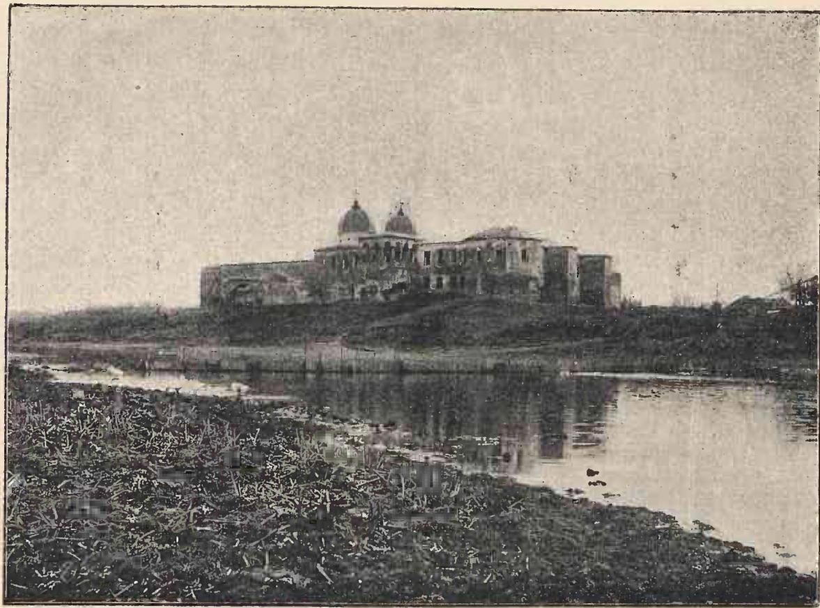
Yederea mănăstirii Comana.