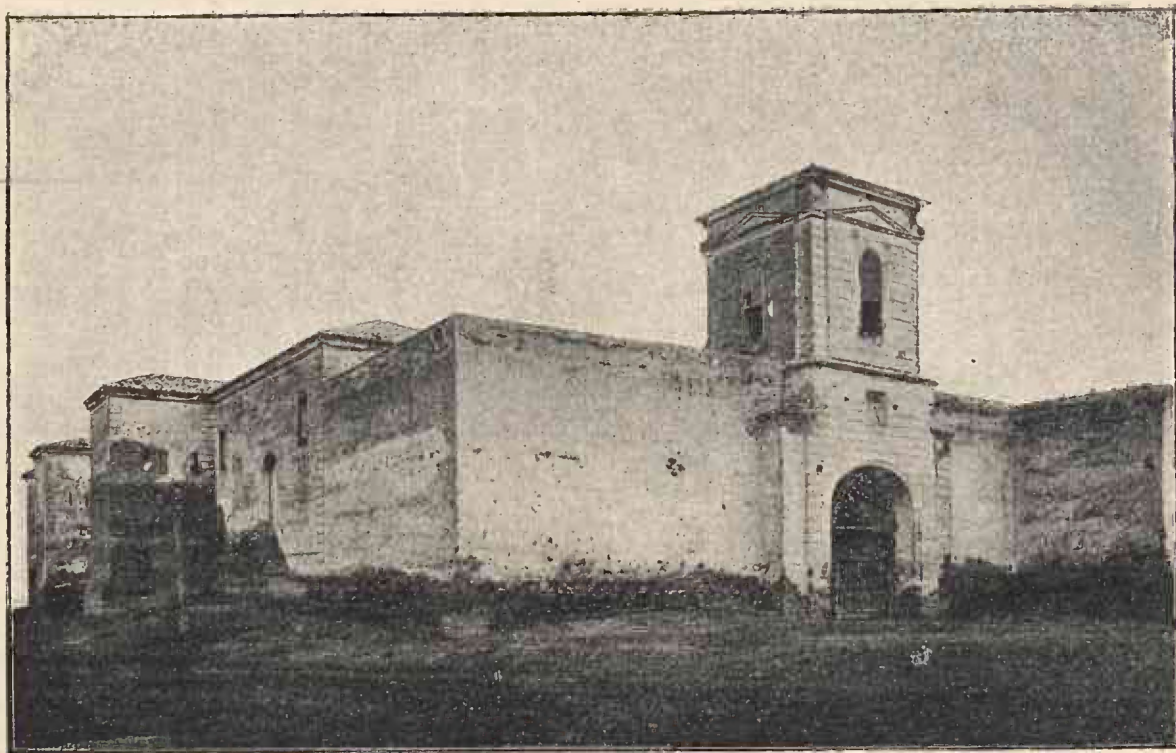
Intrarea mănăstirii Comana.