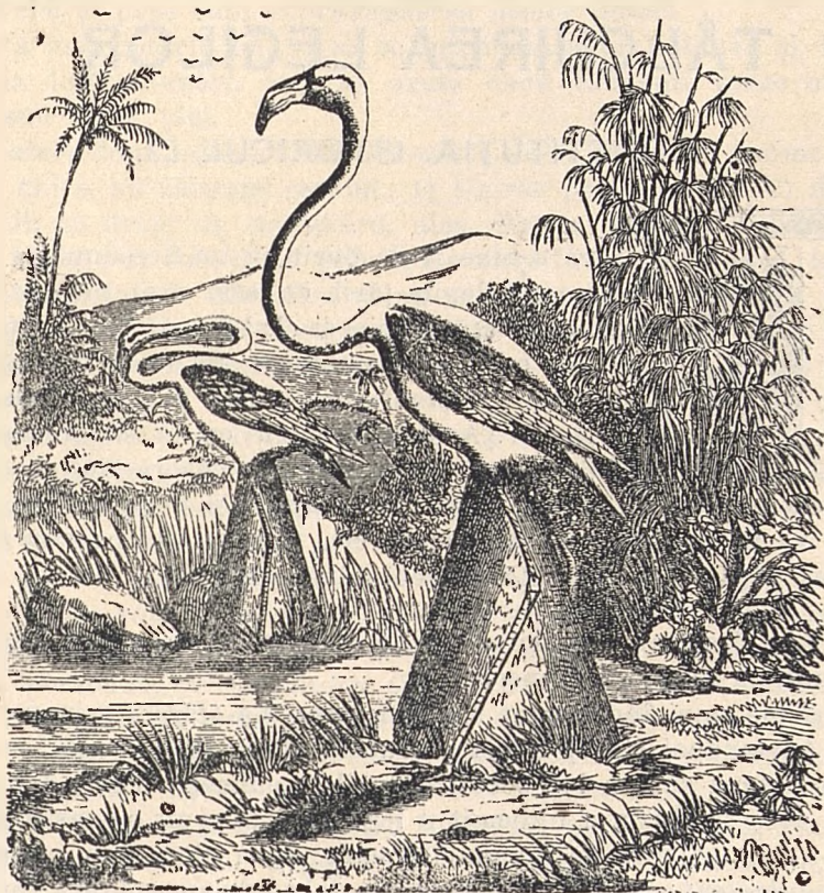
Flamingo. ( Phoenicopterus antiquorum ).

Flamingo ( Phoenicopterus antiquorum ) are ciocul coroiat și nu așa de lung ca Barza. Intre degetele dela picioare are peliță mare, dar nu prea îi place să înnoate. Aripelile lui sunt roșii, cu penele cele mari negre. Incolo peste tot are pene roșietece sau chiar albe. Puii sunt albi cu pete cafenii. Ajunge până la 2 m. de nalt și cu aripelile întinse măsoară 1 m. 7. Trăește în Europa de