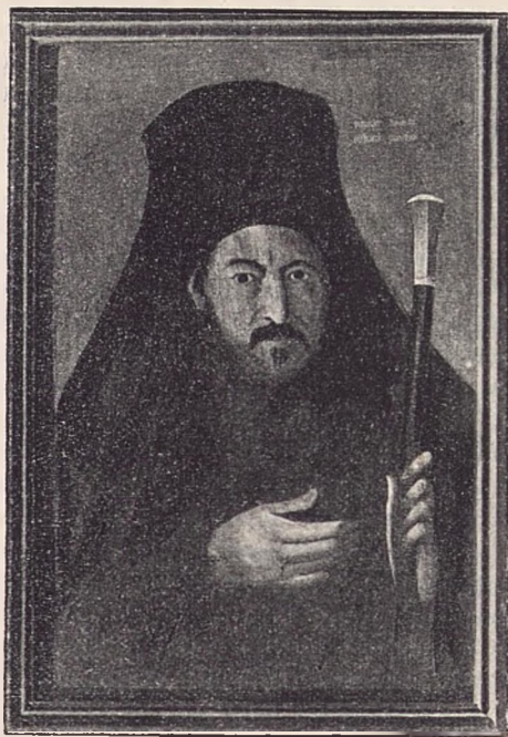
Filaret al II-lea fost Mitropolit al Ungro-Vlahiei. (Com. de Adm. Casei Bisericii).

După ce a fost mai întâiu (pe la 1776) arhimandrit de