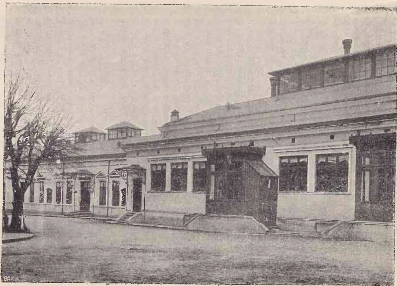
Palatul Camerei Deputaților din București. (Com. de Tip. Cărților Bisericești)