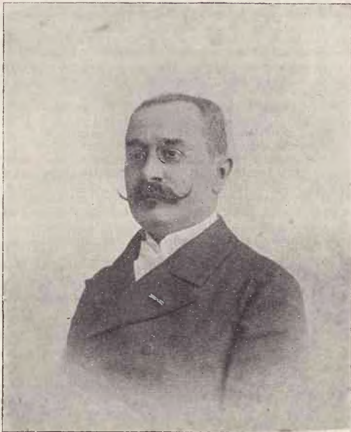
Teodor Mândru (1845–1906).

nu a funcționat mult din motive politice și în fine la 10 Octombrie 1895 cu decretul No. 15.244 a fost numit procuror general la Curtea de Apel din Iași fiind Ministru de Justiție defunctul Eugen Stătescu . În acest post a funcționat până la schimbarea regimului liberal când a fost înlocuit prin d-l M. Șuțu .