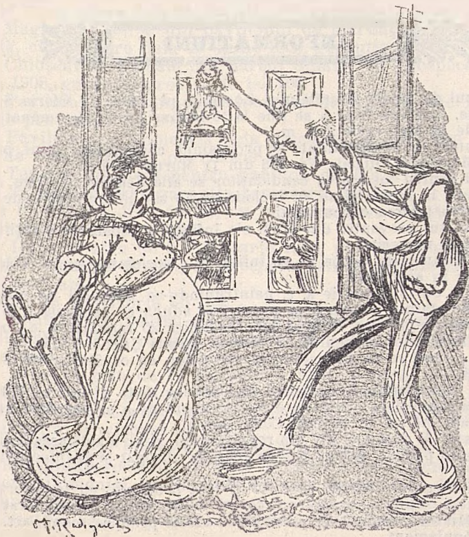
Bețivescu își mângâie nevasta când vine dela cărciumă.