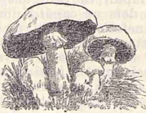
Ciupercă de câmp.

Ciuperca nu respiră din aer decât numai oxigen, și dă afară anhidrida carbonică, deci ea strică aerul unde crește. Locurile unde crește ciuperca, pe lângă că trebuie să fie grase, trebuie să fie și umede, de unde se și explică că ciuperca crește mult și se înmulțește mult în lunile de primăvară și vară, ca și în lunile de toamnă, dacă timpul este călduros și ploios, prin livezi, prin grădini, răsadnițe și pe lângă arie, unde se treeră grâul și alte cereale.