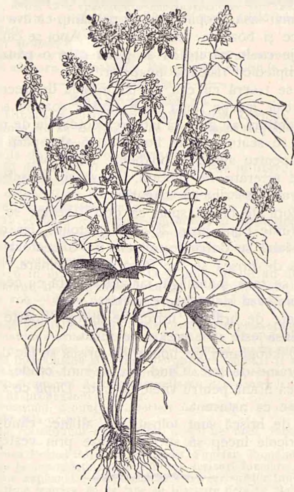
Hrișca sau grăul negru.

Hrișca se seamănă pe la sfârșitul lunii Aprilie și chiar în Mai, de obicei prin împrăștiere. La un hectar se aruncă între 70—80 litri, după felul pământului. Într'un pă-