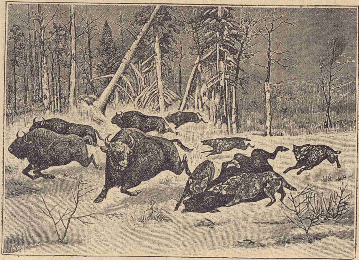
Zâmbri urmăriți de lupi.