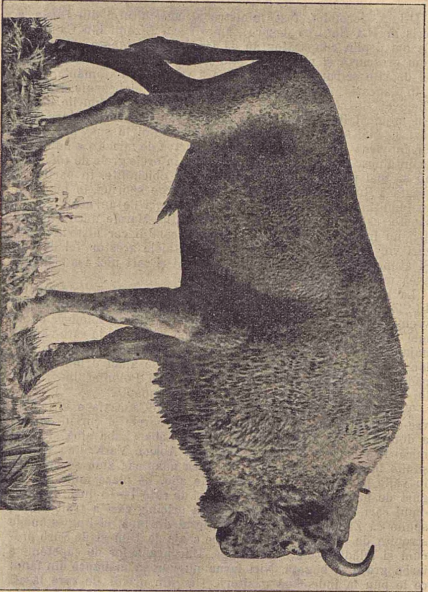
Zâmbru din Caucazia.