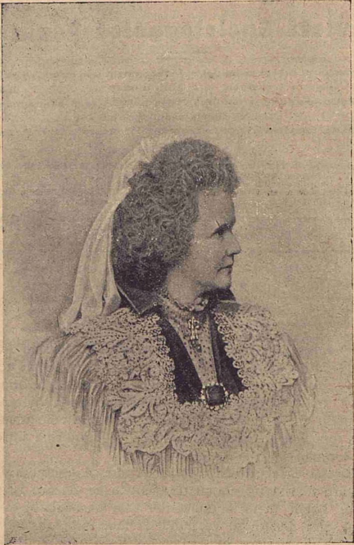
Majestatea Sa Regina României.