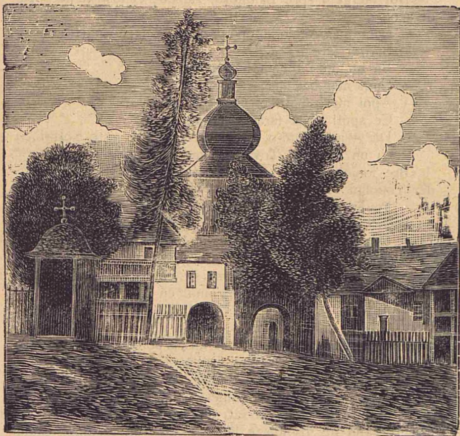
Intrarea mănăstirii Văratecul (înainte de incendiu).