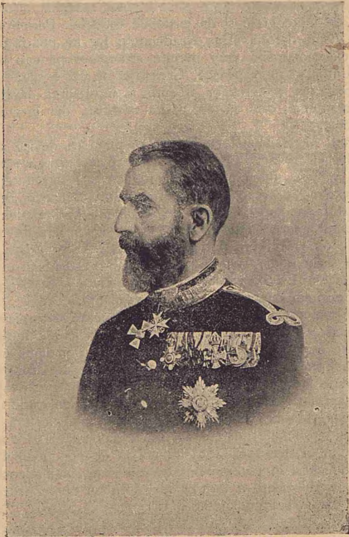
Majestatea Sa Regele României.