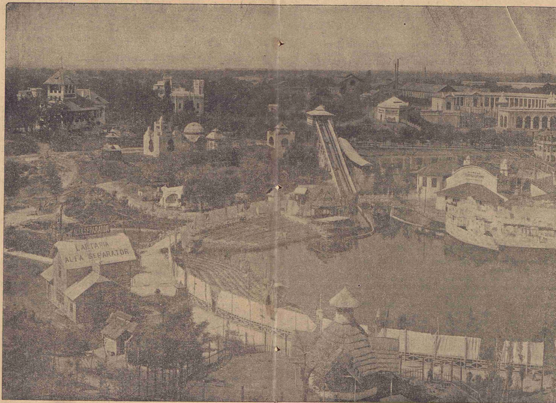
Partea centrală a Expoziției Generale din București, 1906.