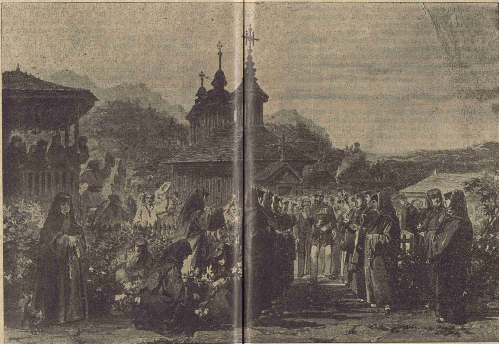
Vizita M. S. Regelui Carol I la mănăstirea S. Gheorghe, din Pârscov, județul Buzău, 1868.