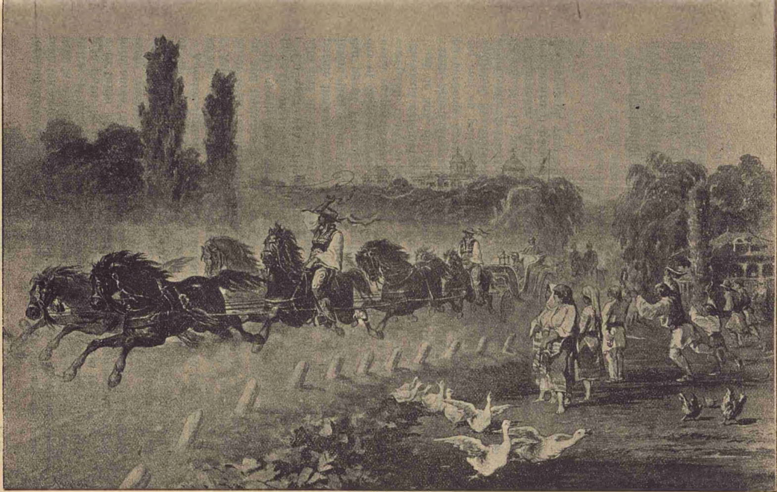
Cum călătoria M. S. Regele în trecut.