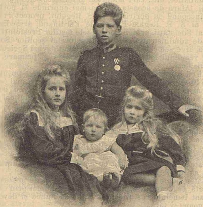
AA. LL. RR. Principii Carol și Nicolae și Princesele Elisabeta și Maria.